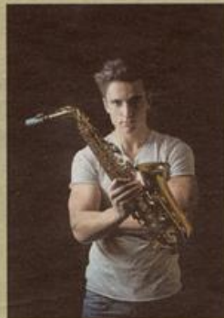
„Saxokid“ wird die Zuhörer im Skyline begeistern.

„Die Nacht der Blauen Wunder“ kommt erstmals nach Erding.