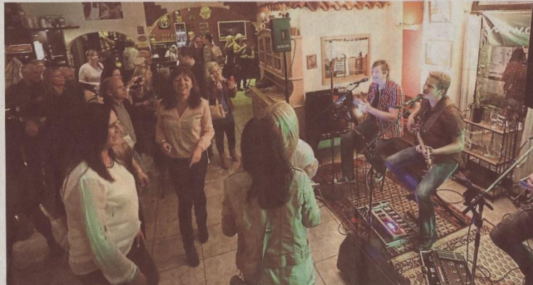
Spätestens beim Hit „Skandal im Sperrbezirk“ waren die Gäste im Zeitlos nicht mehr auf ihren Stühlen zu halten. Domino Effekt sorgte in dem Erdinger Restaurant für gute Stimmung.

Das Prinzip war einfach und wurde auch meistens durchgehalten: Eine halbe Stunde spielte die Band, dann war Pause, denn die Gäste sollten ja, entweder zu Fuß, mit besagten Bussen, oder mit dem Rad, die nächsten Lokalitäten ansteuern können. Das Auto war übrigens ausdrücklich nicht zu empfehlen, denn Kraftfahrer konnten sehr schnell anderen Autos begegnen, und zwar solchen mit blauen Lichtern oben drauf: Mitarbeiter des Veranstalters jedenfalls berichteten von verschärften Alkoholkontrollen. Darum gab es ja die beiden Busse. Aber